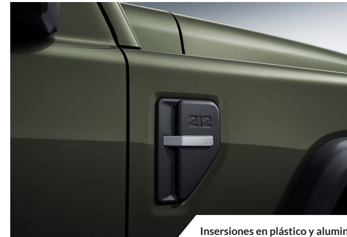
Inserciones en plástico y aluminio

Los parámetros, imágenes, precios y características indicados en la ficha técnica, el folleto comercial o la página web tienen un carácter meramente informativo y no constituyen un documento contractual. Dichos datos podrán ser modificados en cualquier momento y sin previo aviso, pudiendo implicar costes adicionales en determinados casos. La configuración específica de cada modelo, así como su precio final, deberán ser confirmados por un distribuidor autorizado de Kngloo o por Kngloo. Toda confirmación estará sujeta a las condiciones comerciales vigentes en el momento de su validación y conforme a la normativa aplicable en España y en la Unión Europea.