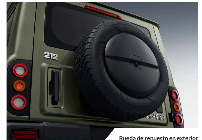
Rueda de repuesto en exterior