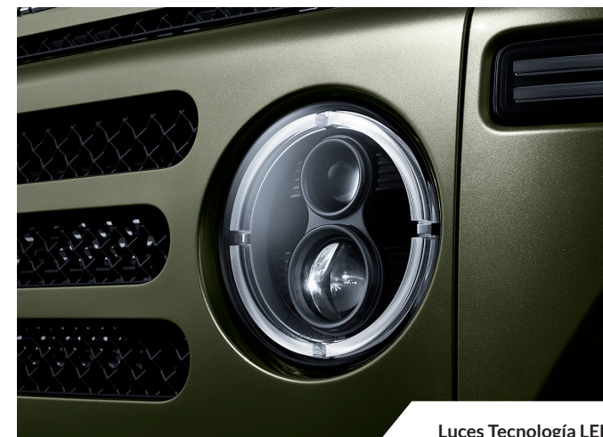
Luces Tecnología LED