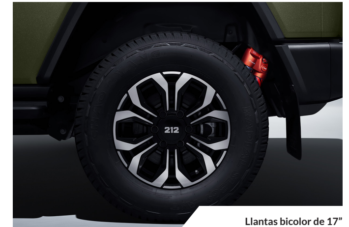
Llantas bicolor de 17"